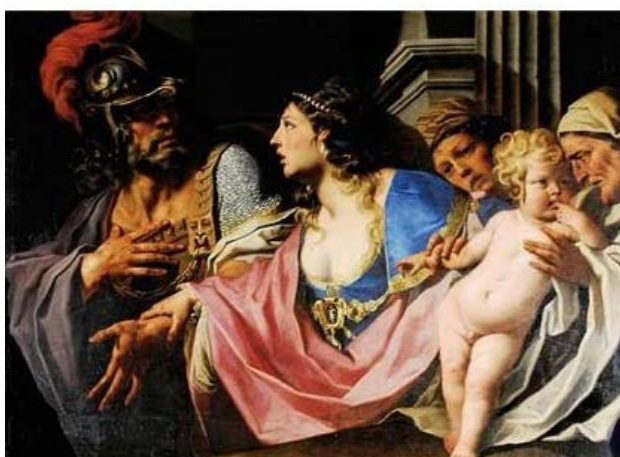
Héctor se despide de Andrómaca (óleo de Luca Ferrari)

Gracias a su ausencia y a otros sucesos, los troyanos, liderados por Héctor, consiguen importantes victorias, y aunque el mismo Agamenón se humilla y le pide que regrese a la lucha, Aquiles se niega. Será precisa la muerte de Patroclo, su mejor amigo, a manos del héroe troyano Héctor (hijo de Príamo, rey de Troya), para que Aquiles deponga su actitud. Aquiles jura vengar a Patroclo, se lanza ferozmente a la lucha y vence a Héctor. Su furia parece irrefrenable: ata a su carro por los pies el cadáver de Héctor y lo arrastra con la cabeza por el polvo alrededor de la tumba de Patroclo.